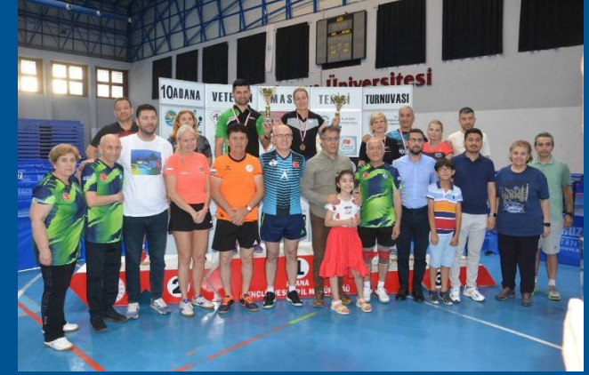
Uluslararası Veteranlar Masa Tenisi Turnuvası 2023 Adana

→ Sosyal sorumluluk projesi kapsamında depremde etkilenen illerimize yönelik eğitim kamplarımız düzenlenmiş v e bu illerdeki sporcuların sahada kalmaları sağlanmış, Kahramanmaraş'ta çadır salon kurulup donatılmıştır.