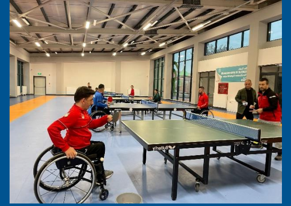
Altındağ Engelsiz Masa Tenisi Salonu