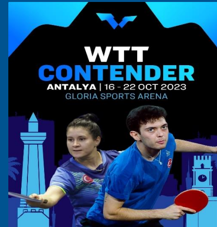
WTT Contender Antalya 2023