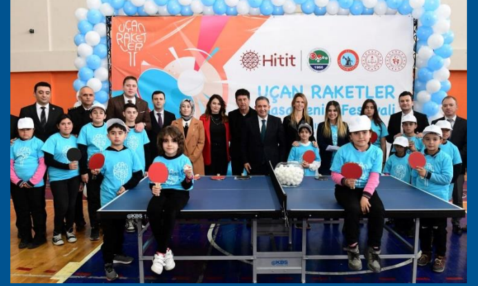
Uçan Raketler Projesi Kırşehir

→ Ülke genelinde v eteran v e kurumlar turnuvalarımız aksamadan devam etmektedir.