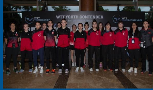
WTT Youth Contender Antalya 2023