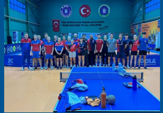
Rus Milli Takımı ile Ortak Milli Takım Kampı Bursa