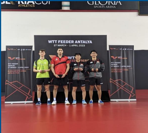
WTT Feeder Antalya 2023