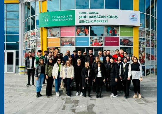
Aday Hakem Kursu 2023 Niğde