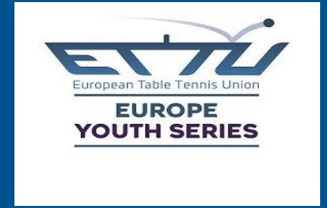
ETTU Youth Series Türkiye Open 13 -17 Mart 2024 tarihlerinde Nevşehirde düzenlenecektir