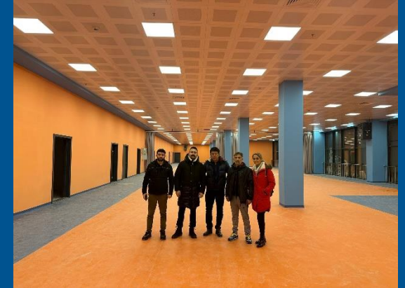
Eryaman Masa Tenisi Salonu