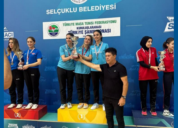
Kuruluşlararası Türkiye Şampiyonası 2023