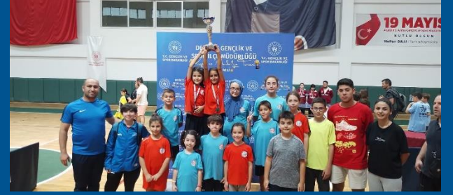
Minik – Minik Altı – Küçükler En İyi Seçme Şampiyonası 2023