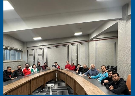
4. Kademe Antrenör Kursu 2023