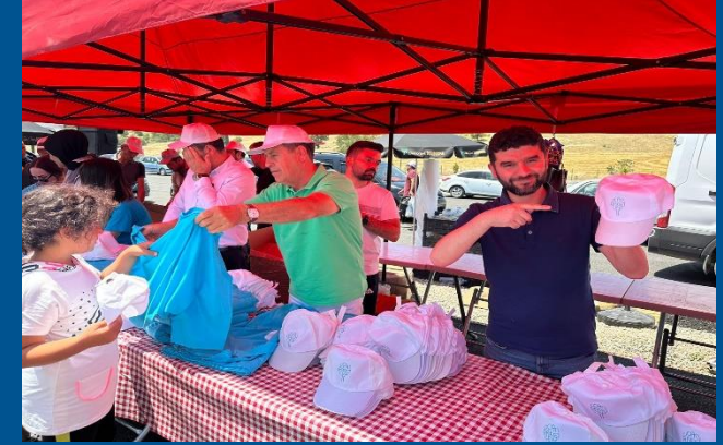
Kahramanmaraş'ta depremzedelere yönelik gerçekleştirilen faaliyetler