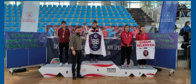
Yıldız – Genç En İyi 16'lar Yarışmaları