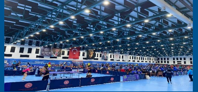
Süper Lig 2. Etap Samsun 2023