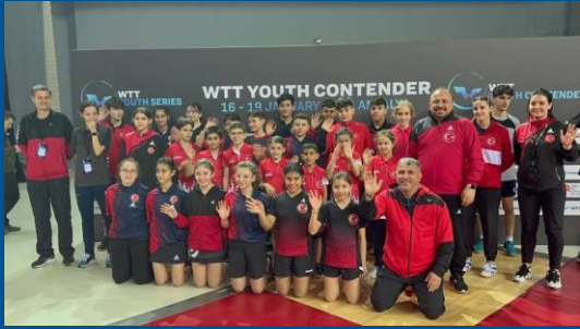
WTT Youth Contender Antalya 2024

→ Bu 3 yıllık dönemde, ülkemizde uzun yıllar boyunca gerçekleşmemiş uluslararası olimpik puanlı organizasyonlar düzenlenmiştir.