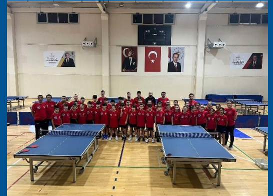
Minik – Küçük Milli Takım Kampı